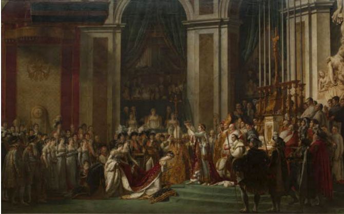
Le sacre de Napoléon et l'impératrice Joséphine, J.L David, Huile sur toile, 1808, Musée du Louvre, Paris.

Né en Corse en 1769 dans une famille de la petite noblesse, Napoléon Bonaparte fait des études militaires. Il se fait connaître sous la République en reprenant la ville de Toulon aux Anglais. Nommé Général en 1795, il remporte de nombreuses victoires contre l'Autriche. Puis, il est envoyé à la conquête de l'Égypte. En 1799, il revient en France et s'empare du pouvoir par un coup d'État le 9 novembre 1799. Il prend le titre Consul et met fin à la période révolutionnaire. Le Consulat donne presque tous les pouvoirs à un premier consul, c'est-à-dire lui-même. Puis il se fait nommer Consul à vie par un plébiscite du peuple français. Il maintient les grands acquis de la Révolution, en particulier l'égalité des droits. Le 2 décembre 1804, fort de sa popularité, Napoléon Bonaparte se fait sacrer empereur par le pape, sous le nom de Napoléon Ier. Dès 1803, il s'est lancé à la conquête de l'Europe, mais en 1812, il perd une grande partie de son armée dans les campagnes de Russie. Il quitte le pouvoir en 1815 suite à sa défaite à Waterloo. Il est alors exilé sur l'île de Sainte-Hélène où il meurt en 1821.