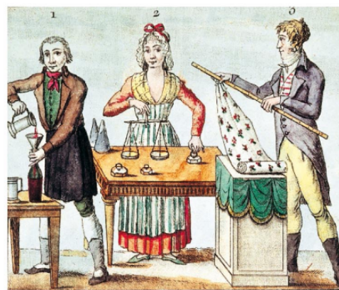
5 Les nouveaux poids et mesures (1795)

(Gravure de Labrousse, XVIII e siècle, musée Carnavalet, Paris.)