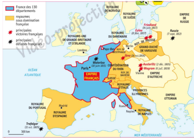
Titre : Carte des Etats conquis par la France en 1811