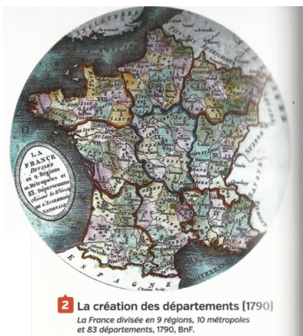
2 La création des départements (1790)

Les poids et mesures étaient très différents d’une région à l’autre. La loi de 1795 crée un système uniforme et rationnel pour toute la France : le mètre, le gramme, le litre la stère, l’are.