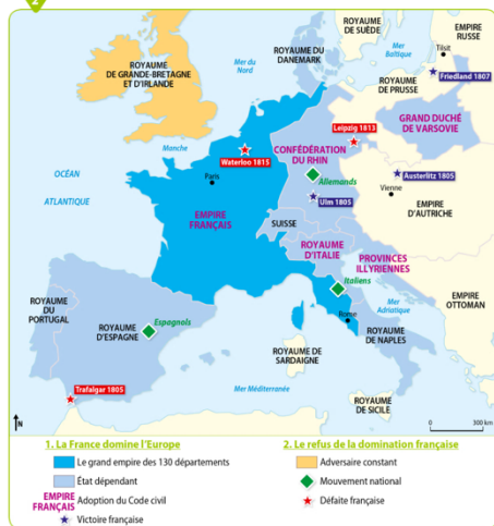
L'échec d'une Europe française, 1799-1815

A l’aide du livre p. 57 et de la carte projetée, complétez le croquis suivant.