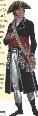
Un préfet sous le Consulat, début du XIX e siècle.

1. Allusion aux tensions et guerres civiles que la France a connues. 2. Rancunes. 3. Impôts.