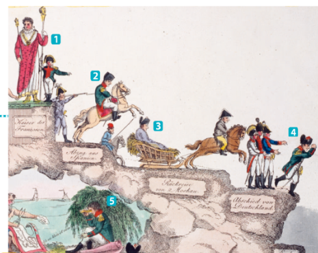
3 La chute de Napoléon, caricature allemande, 1814

Gravure, Ascension et chute de Napoléon Bonaparte , 1814, 23 x 36, 8 cm. Musée historique de Berlin. Allemande.