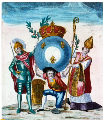
3 La société d’ordres au XVIII e siècle

Doc 3 p.41 et Doc 1 p.66 + Docs Nathan et Hatier