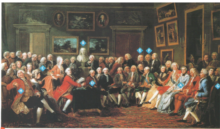
2 Le salon littéraire et philosophique de Mme Geoffrin, à Paris, en 1755

Gabriel Lemonnier, s1812. Huile sur toile (62 x 96 cm). Musée des Beaux-Arts de Rouen. Lecture de L’Orphelin de Chine , une tragédie de Voltaire, alors en exil. Bourgeoise ouverte aux idées nouvelles, Mme Geoffrin accueille de 1749 à 1777 dans son hôtel particulier des savants, des hommes de lettres et des personnalités influentes de la noblesse ou de la bourgeoisie. (A) Mme Geoffrin, (B) Buste de Voltaire, (C) Rousseau, (D) d’Alembert, (E) Quesnay, (F) Diderot, (G) Montesquieu, (H) Buffon.