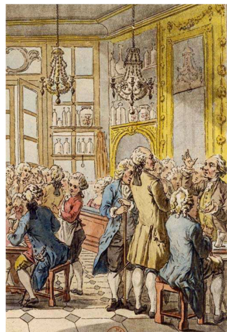
5 Le café Procope

■ À quelles catégories sociales appartiennent les participants à ce salon ?